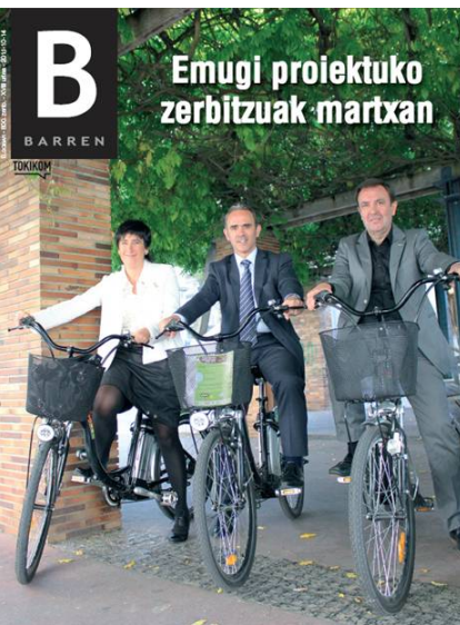
Elgoibar Berdea. Emugi proiektuko zerbitzuak martxan. BARRÉN. TOKIKOH